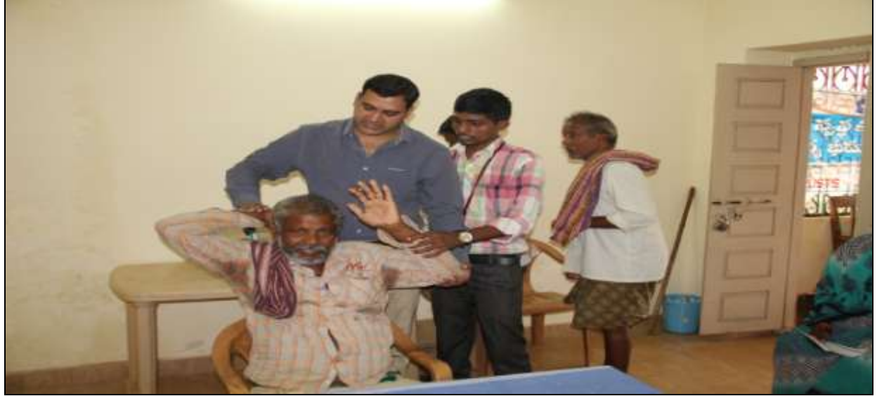
Doctor observing the old age patient