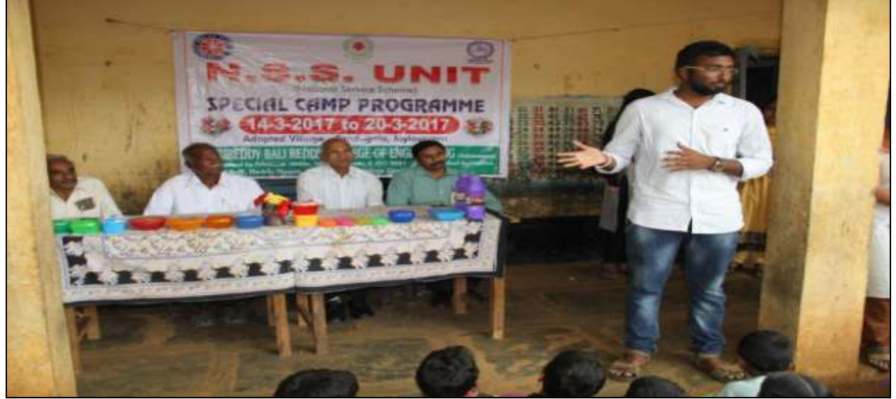
A volunteer expressing her views as the Director looks on