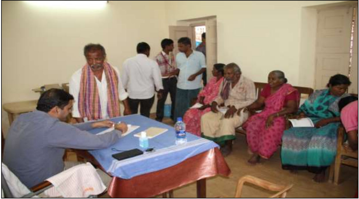
Old Age People Rush at the medical camp...