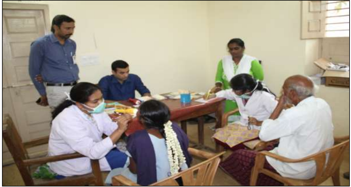
A view from the Medical camp