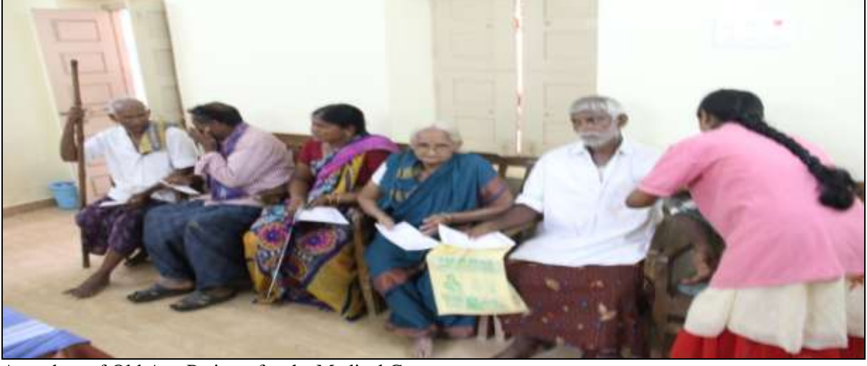
Attendees of Old Age Patients for the Medical Camp