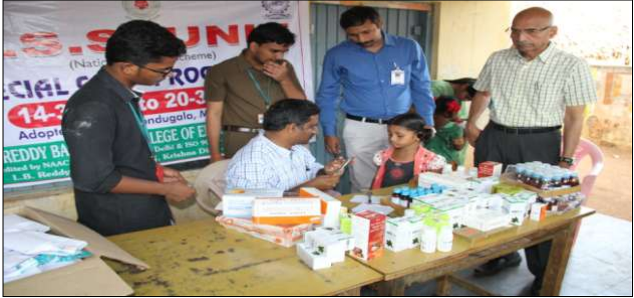
The Doctor in action at the medical camp