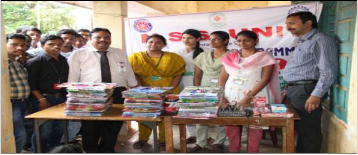
NSS Program Officer and NSS Volunteers with Exam Kits