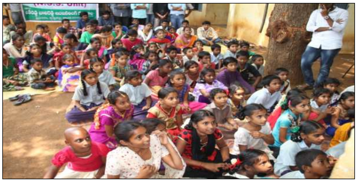
School children at the valedictory program