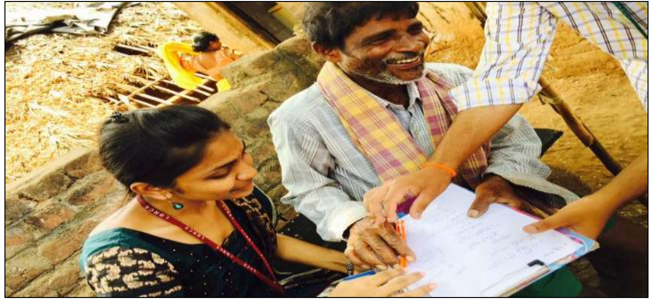
NSS Volunteers conducting Literacy Campaign