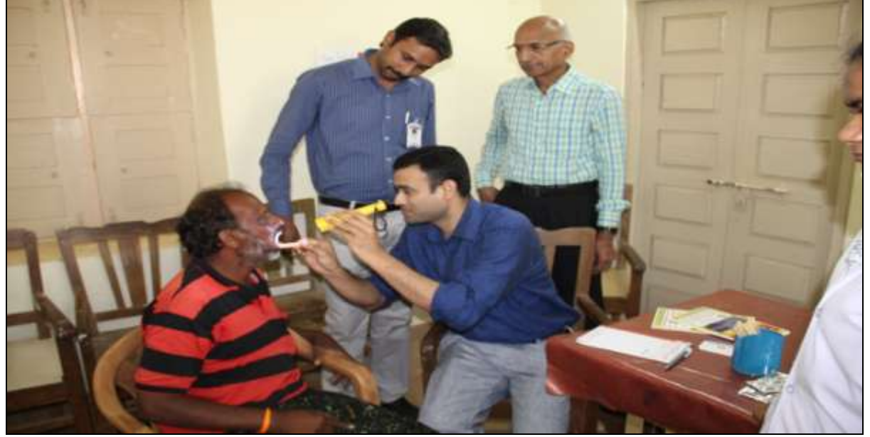
Doctors examining an old villager @ the Cardiac camp