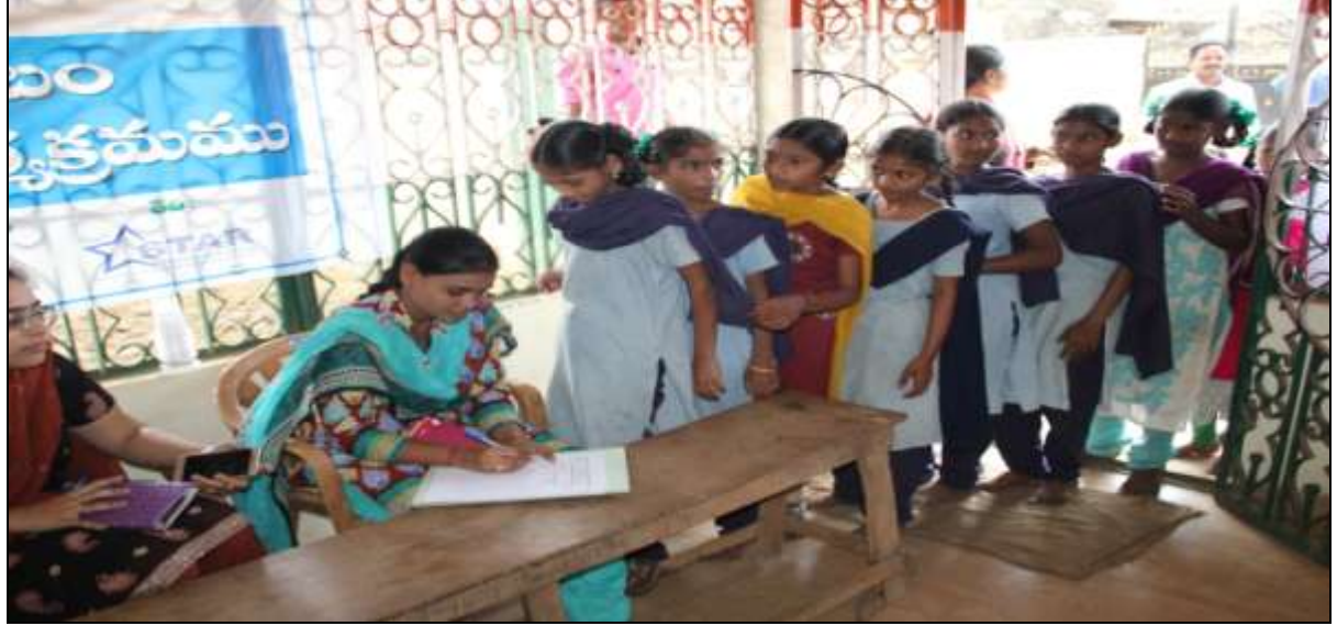
School Children wait in line to avail medical services @ the Cardiac camp.