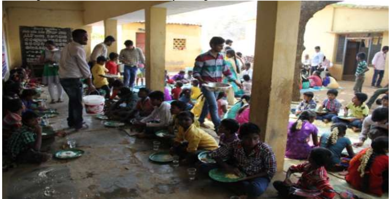
NSS Student Volunteers serving food to school children