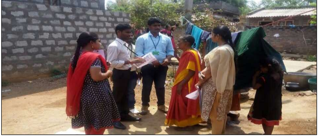
Students collecting Self Toilets Information among the village people