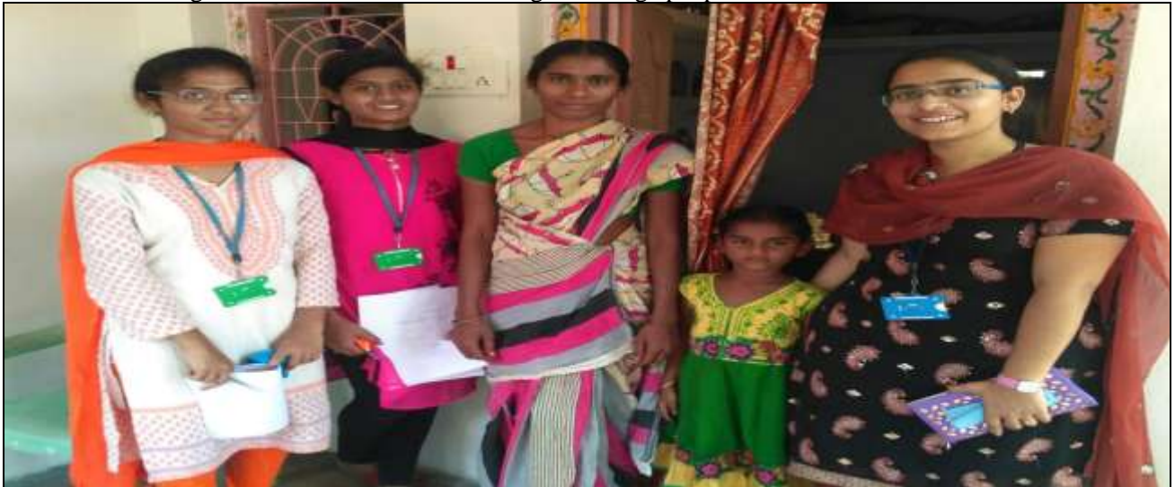
Students collecting Self Toilets Information among the village people