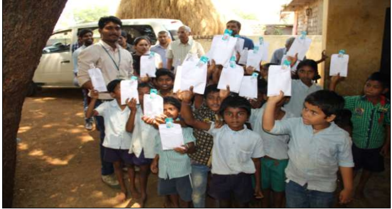
Children's displaying the Dental Kit's