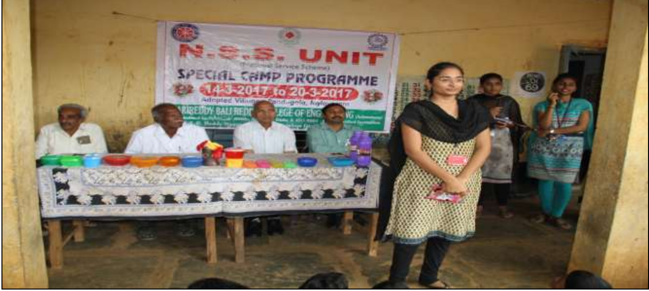
A volunteer sharing her views about NSS Special Camp