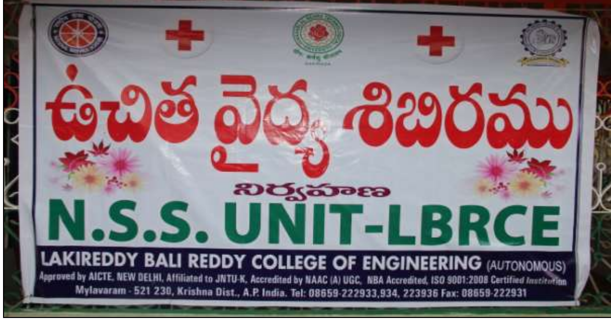
Banner displayed during Free Medical Camp